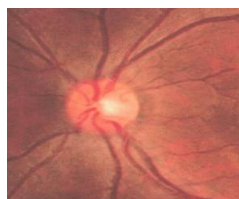
正常な視神経乳頭

眼底検査とは目の奥にある眼底の網膜、視神経乳頭等を調べる検査です。緑内障に特有の所見を観察します。目の奥を見るために瞳孔を開く目薬を入れて20～30分程待つから検査を行います。機器で眼底の写真撮影や医師が直接、眼底の状態を確認します。