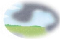
進行期の視野障害