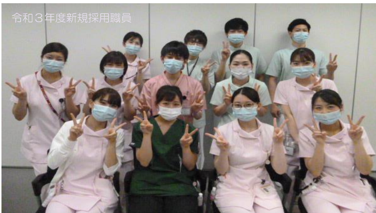
令和3年度新規採用職員