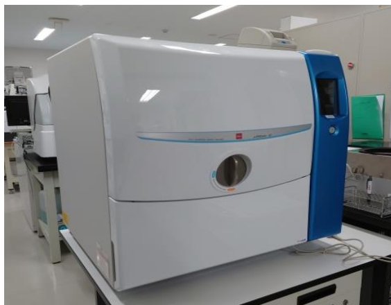
ミュータスワコーg1

現在、入院される皆様に感染拡大防止の為、入院時のPCR検査を受けていただいています。来院後、検査技師や看護師が検体採取に伺いますので、ご協力をお願いします。