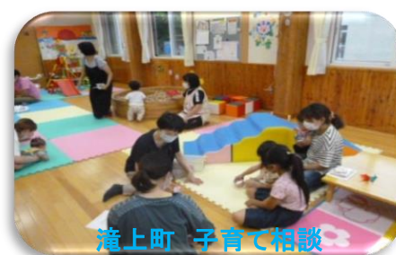
滝上町 子育て相談

地域の保健師と一緒にママや赤ちゃんにお会いして話しをうかがい、安心して地元で暮らし続けられるようお手伝いをしています。