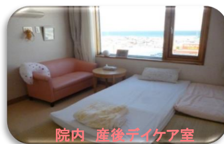
院内 産後デイケア室

毎週木曜日、午前10時から午後3時まで畳の部屋でゆったり過ごせます。おいしい昼食付です。