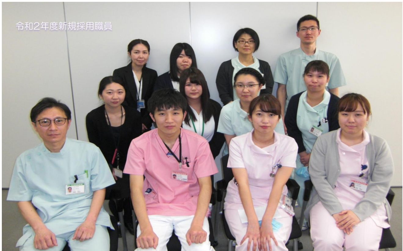
令和2年度新規採用職員