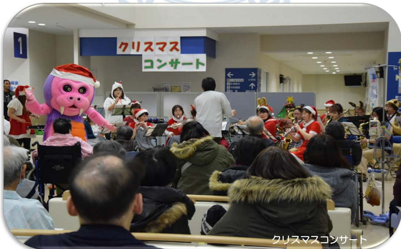
クリスマスコンサート